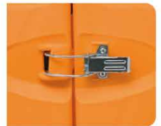
Cierres externos metálicos