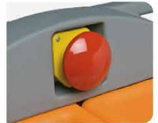
Paro de emergencia externo