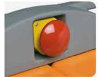
Paro de emergencia externo