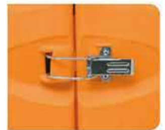
Cierres externos metálicos