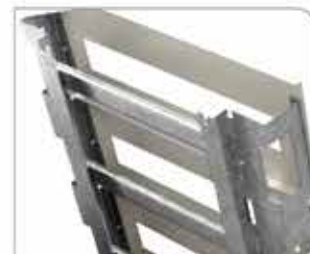
Vista de Estructura